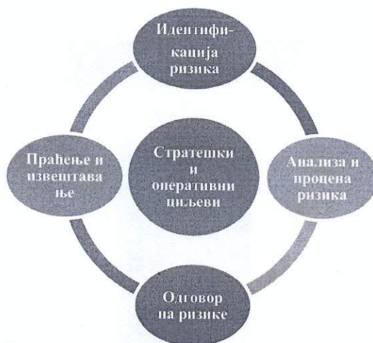
Слика 1. Процес управљања ризицима

Процес управљања ризицима састоји из четири основна корака која се примењују и на стратешке и на оперативне ризике: 1) идентификација ризика; 2) анализа и процена ризика; 3) одговор на ризике; и 4) праћење и извештавање.