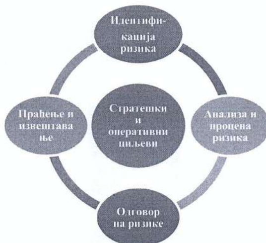
Слика 1. Процес управљања ризицима

Процес управљања ризицима састоји из четири основна корака која се примењују и на стратешке и на оперативне ризике: 1) идентификација ризика; 2) анализа и процена ризика; 3) одговор на ризике; и 4) праћење и извештавање.